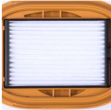
高性能フィルター