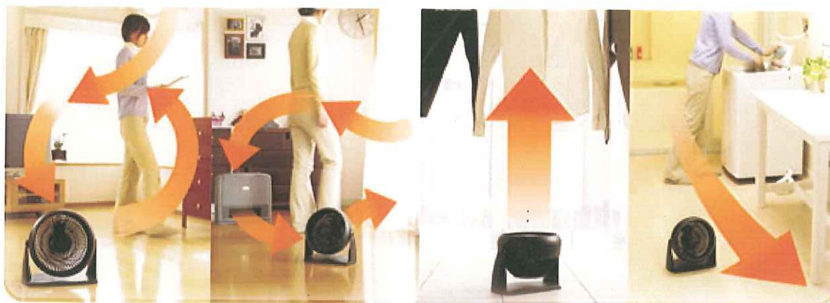
冷・暖房の効率化に